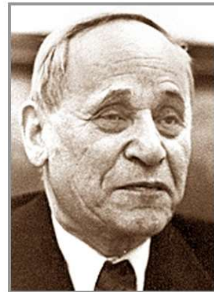
Вольф Соломонович Мерлин